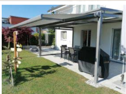
Beschattung und Sonnenschutz